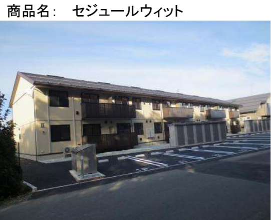
※パース写真の場合は、現況優先とします。

SECOM セコムセキュリティシステム搭載 ※鍵を一本、警備会社へお渡しいたします。