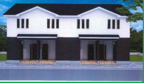
ラディーチェB棟(アパート)